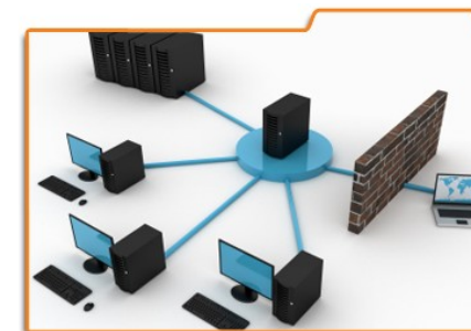
Integracja systemów i programów