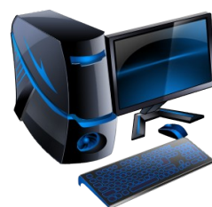
Dostęp dla wszystkich do rzeczy wcześniej niedostępnych