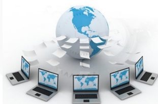
Internet i ... już...