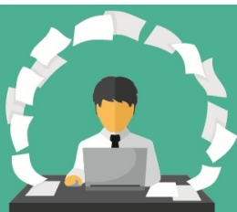
JRWA, instrukcja kancelaryjna